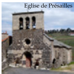
Eglise de Présailles

A la découverte des monts de Breysse. Randonnée proposée par J.Louis Jourde.