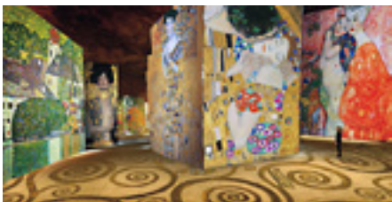
Les Carrières de Lumière

Sortie culturelle Provence-Marseille > 2 et 3 octobre 2015 :