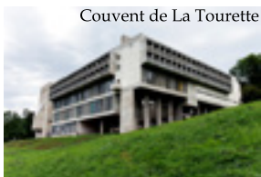
Couvent de La Tourette