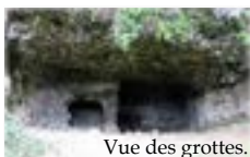
Vue des grottes.

Visite guidée Les grottes de Couteaux avec Jean-Paul Béal .