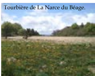
Tourbière de La Narce du Béage.