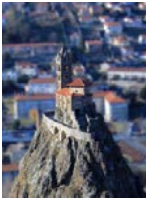
Rocher et Chapelle Saint-Michel d'Aiguilhe.

> le 21 ou 28 (suivant météo), le matin, Le Puy-en-Velay.