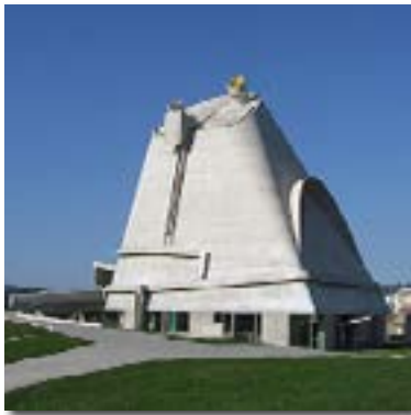
Eglise Saint-Pierre de Le Corbusier.