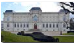
Façade rénovée du Musée Crozatier.

> le 21, Le Puy-en-Velay, Musée Crozatier.