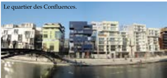
Le quartier des Confluences.

depuis les origines, et l'humanité dans son histoire et sa géographie que le musée des Confluences interroge.