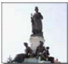
Détail de la fontaine, place du Breuil.