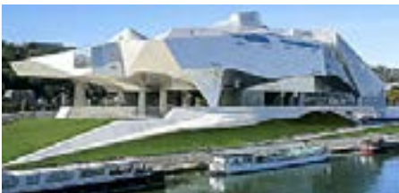
Musée des Confluences.