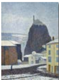
Dubois-Pillet Albert, Saint Michel d'Aiguilhe, © Musée Crozatier.