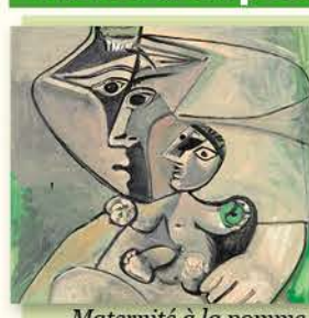
Maternité à la pomme.

Visite d'exposition : > le 18 à 16h et le 23 à 10h, Hôtel-Dieu le Puy-en-Velay.