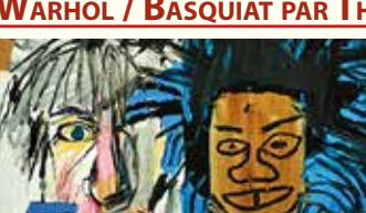
Jean-Michel Basquiat, Deux têtes, 1982

Cette conférence cherchera à présenter leur lien entre admiration et prise de pouvoir et de dénouer les différentes influences de l'un sur l'autre.