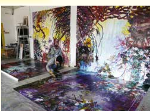
Atelier Velay, 2018 © Cristine Guinamand

Dans son œuvre, que ce soient des peintures, avec ou sans collages, des dessins, des sculptures ou des constructions diverses (série des « Théâtres » en 2014), Cristine Guinamand ne cesse de mettre en scène les thèmes de la vie et de la mort, et des actes qui s'y rattachent symboliquement.