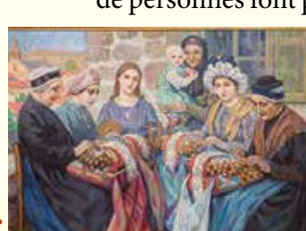
Le coupage