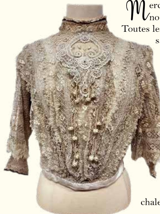
Corsage en dentelle du Puy : don de la SAMC au Musée Crozatier.

Merci de votre fidélité, après ces deux années difficiles, voici le nouveau programme d'activités.