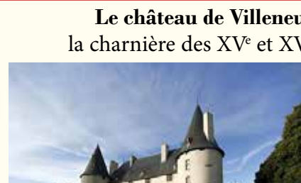
L. Boudal: Une œuvre de la maturité.

* Le nom de Murol se vit ajouter un « s » au XIX e siècle. Le Conseil d'État ne rétablit qu'en 1953 l'orthographe originelle de la commune.