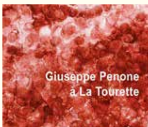
G. Penone, Missel dominicain de La Tourette, 2022, 182 x 297 cm