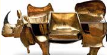
François-Xavier Lalanne, Rhinocéros II, 1966

Connus pour s'être manifestés conjointement, Claude (1925-2019) et François-Xavier Lalanne (1927-2008) ne forment qu'un aux yeux du public. En fait, ils n'ont produit que très peu d'œuvres en commun et possèdent, chacun, un univers particulier. Ils partagent toutefois un goût pour des figures animales, hybrides, nourries de surréalisme. Les plus célèbres d'entre elles situent leur œuvre à la limite de la sculpture et du design.